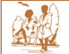
4. Frische Luft