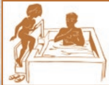
6. Kaltes Eintauchbad