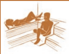
3. Saunagang (8 bis 12 Min.)