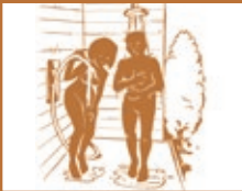
5. Kalte Körperdusche